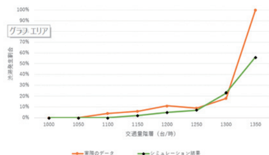
図 6.2. 3 車線シミュレーションと実測データの比較。

同じ条件で、3 車線シミュレーションを行った。図 6.2 はセルラオートマトンモデルを用いた 3 車線シミュレーションと加久藤トンネルの渋滞発生割合を比較したものである。3 車線シミュレーションでは総合的に渋滞の緩和が確認できた。しかし、交通量階層によっては渋滞発生割合が実測データより高いところがあった。また、1350 台から 1400 台の階層で 50% を超える結果が出た。