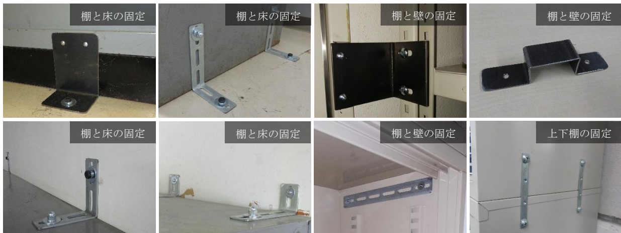
図1 耐震工事で使用する固定具例

依頼者から耐震工事の依頼が来ると、職員が固定場所の壁や床の構造・材質・耐震強度を考慮し、固定方法とそれに伴う固定具を検討した上で依頼者へ見積りの提示を行う。固定具は、既製品を使用する場合もあるが、求めるサイズの固定具がないことやコストダウンの理由で主に自作をしている。以下に固定具の例を示す(図1)。