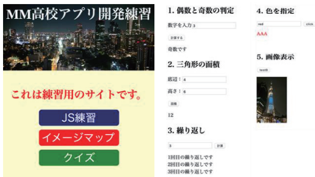
図 10 : 練習用アプリ画面 図 11 : JavaScript 練習用ページ