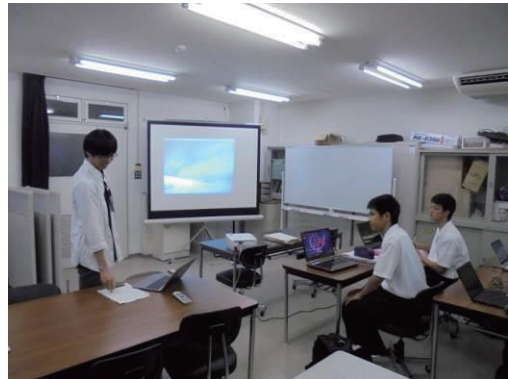
図9：課題研究のための演習風景