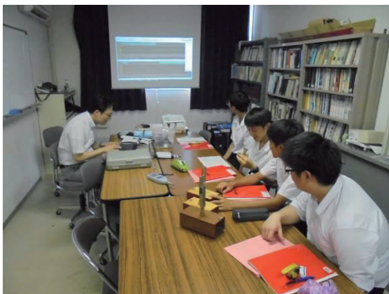
図3：ミーティング時に実験を行っている様子

学生の活動は、主に宮崎南高校の課外時間に行われたため、実験に立ち会うことはできなかった。そこで、大学で行うミーティングの際に進捗状況を報告してもらい、実験装置の製作や実験方法について指導した。その際、学生自身で考えてたことを尊重するために具体的な指示は行わず、実験が円滑に行えるように助言する程度に留めた。課題研究発表会までに宮崎大学で行ったミーティングの回数は3回であり、その他にメールで連絡をとりながら発表ポスターの作成に関して指導した。