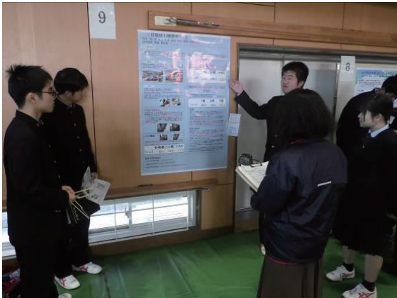
図5：課題研究発表会で発表している様子