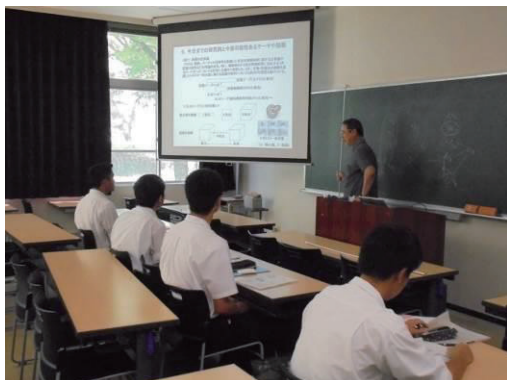
図8：課題研究のための講義風景

本課題は、県立宮崎南高等学校のフロンティア科2年の総合科学による課題研究への協力依頼で実施したもので、生徒4名への指導を担当した。生徒は、最終的に自分たちで考えたテーマに沿って課題研究を進めていくことになり、そのための基礎的知識や技術を受けた。1回目のミーティングでは、課題研究に必要な映像技術の知識について講義し（図8参照）、2回目からは具体的なWebデザイン技術やプログラミング等について演習形式で指導を行った（図9参照）。課題を進めていく中で、研究テーマを観光支援アプリの試作に絞ることになり、自ら観光アプリ「宮崎を救う神話アプリケーション」を制作できるよう必要となる知識や技術についてプログラミング課題を解きながら身につけて頂いた。開発環境および演習の概要は以下の通りである。