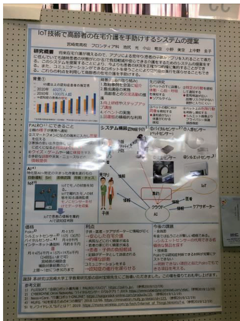
図1：課題研究発表(ポスター発表)会時のポスター

最後に、本課題研究のまとめとして2019年12月27日に課題研究発表(ポスター発表)を行っている(図1参照)。ポスター作製に関しては事前にメールで数回やり取りをし、指示された内容を修正して、ポスター発表を行った。