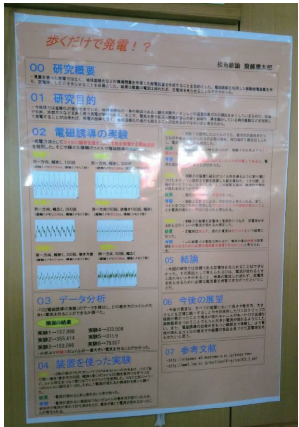
図6：課題研究発表会でのポスター

本課題研究のまとめとして2019年12月27日に課題研究発表会(ポスター発表)を行った。ポスターのまとめかたについては指導を行っていなかったが、図6のように高い完成度でまとめられていた。また、最終的に最も高い電圧が出る方法を採用し、図7のように上下に動く疑似的な床とコイルで作ったものをポスターの前に展示し、実際に聴講者にも触れてもらいながら説明していて、好印象であった。