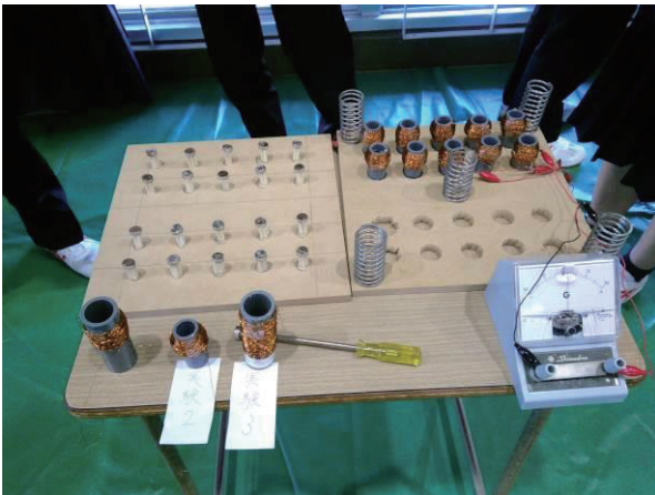
図7：課題研究発表会での展示物（床板を外して左に置いた状態）