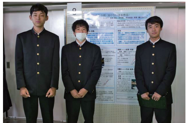
図2：課題研究発表会で発表している様子

最後に、本課題研究のまとめとして2019年12月27日に課題研究発表(ポスター発表)を行っている様子を図1に示す。一生懸命頑張った研究成果を自信を持って成果を発表しており、聴講者からの質問にも的確に答えていた。