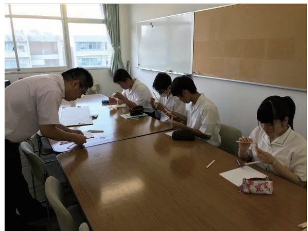
図4：ミーティング時にトラス構造を作成している様子

1回目のミーティングで、課題研究での実施内容について聞いたところ、災害に強い橋を造り、振動実験などで強さを比較したいという提案であった。しかしながら、短期間で行うには難しい内容であったため、橋の構造に要点を絞り、その強さを探求することとした。まず、橋の構造について、桁橋、アーチ橋、トラス橋、ラーメン橋、斜張橋、吊り橋などの簡単な原理を説明し、一般的な桁橋より、アーチ橋やトラス橋が強いことを、模型を使って確認してもらった。図4は、簡単なトラス構造を作成している様子である。