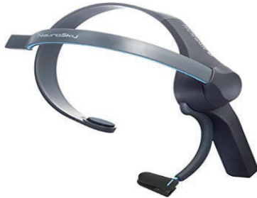
図 1. Mind Wave Mobile.

ニューロスカイ社が販売している機器(図 1 参照)。今回の研究では脳波を測定する必要があるため、この機器を用いる。