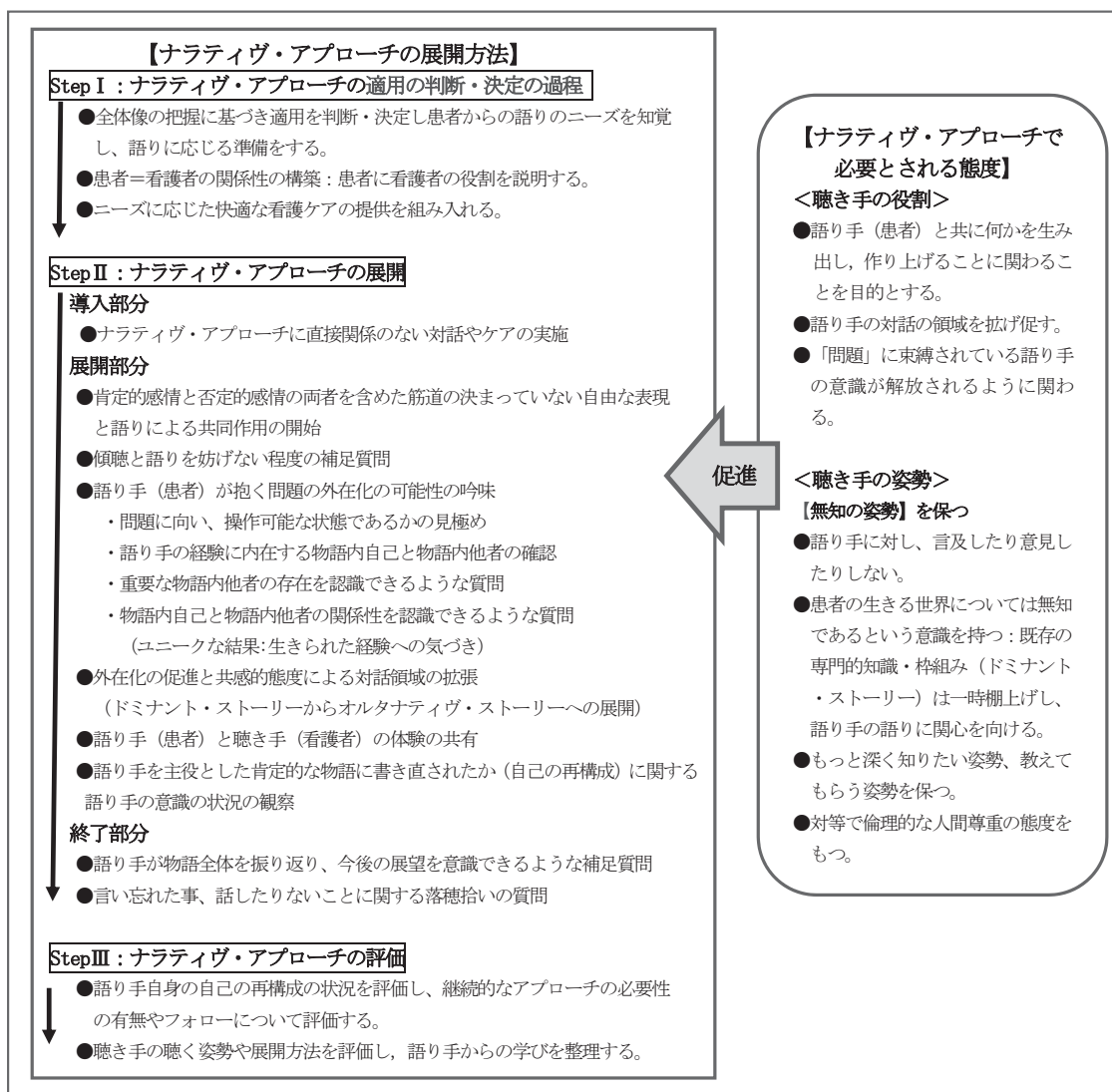
図2 ナラティブ看護実践モデルの実践方法の構造（東・柳川）

「自己の再構成」が挙げられた。用語の説明は本文中及び表1の教材事例中に簡潔に記述した。