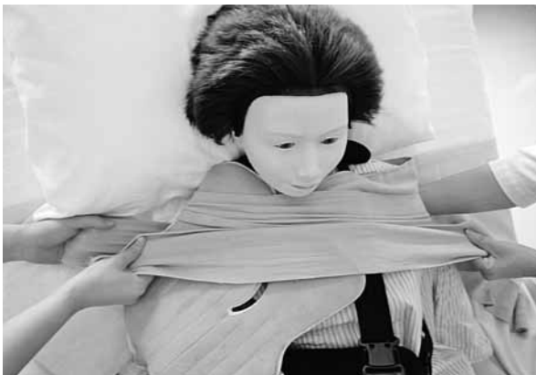
写真1 研究前のクライオセラピーの固定方法

このような状況下A病院では、肩腱板損傷や肩関節脱臼の患者に対して2006年9月より肩関節鏡視下手術を導入し、一年間に約60件の肩関節鏡視下手術を行っている。そして、肩関節鏡視下術後患者に対し、患部の炎症や腫脹の軽減を主目的に、術直後より翌朝までの持続冷却によるクライオセラピーを、2009年10月から実施している。しかし、肩関節のクライオセラピーの実施は近年であるため、既存の冷却装置を固定する専用バンドが市販されておらず、A病院では、医師と看護師が術直後の患者の上体を起こし弾性包帯を巻くことにより固定を行ってきた(写真1)。この固定方法は、