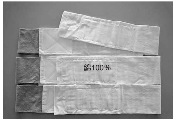
写真2 製作した固定バンド

固定バンドは、患者の皮膚に直接触れるため、強く吸湿性のあることが特徴である綿100%素材の白布をベースに一部弾性包帯とマジックテープを使用して、日本工業標準調査会 (JIS) 規格に準ずるサイズで、S・M・L・LLの4種類サイズを、研究者の手製で製作した (写真2)。