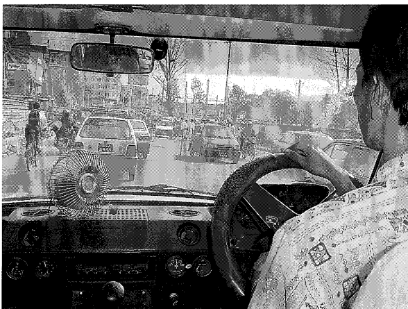
写真2：カトマンズ郊外の往来

TUIOMポカラ校は、学校長が交代していた。訪問したときはJOCVの隊員がマザーボランティアグループとともに保健指導に関する学習会を開