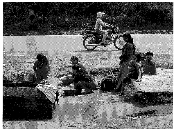
写真3：公共水道で洗濯する住民 (この排水は周辺から再び地下に浸透し上水道に流れ込む可能性がある)