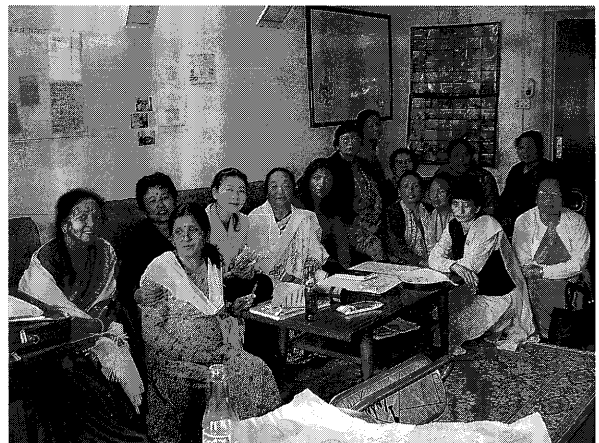
写真1：ネパール看護協会 (左から2人目奥が看護協会長：2002年現在)

まず, 人口の増加とともに, 市内の交通量は飛躍的に増加していた。ネパールでは排ガス規制など無くガソリンの質も悪い。また, 交通量が増えなくても道路などのインフラストラクチャーはほとんど