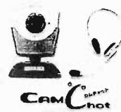
Web カメラ (USB-CAMCHAT2)