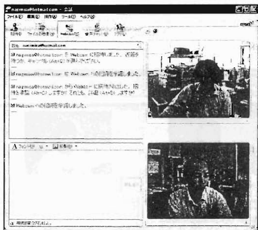
Fig.2 ビデオチャット画像