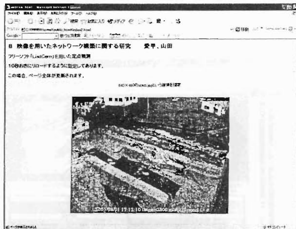
Fig.3 Web ページ画像

研究発表等の公開、いわゆる、ライブ中継に利用できるソフトも多数あり、専用サーバを通しての配信となるが、今回はサーバを通さず直接配信する方法を検討した。使用したソフトで画像サイズ 320*240 ピクセル、ビットレート 340Kbps、フレームレート 30fps とした場合、学内ネットワークで閲覧するには十分である。しかし、今回の場合、配信と閲覧に約 12 秒の時間的ずれがあった。サーバ機とするパソコンの性能にも左右されるが、接続数が少ない場合は、配信速度も良好であるが、接続数が多くなると速度が、減少する傾向が見られた。今回は実験のため、できる限り高画質で配信可能なビットレートで配信したが、現在の学内・学外ネットワークのトラフィックの増大を考えると、もう少し低レートでの配信が望ましい。また、サーバを経由しない場合で一方配信のみでなく、双方向配信を試みたが、双方で約 12 秒ずつの実際の時間との時差があり、違和感があった。しかし、遠方との簡易テレビ会議システム（静止画を見ながらの文字 or 音声チャット）と考えれば利用価値は十分に期待できる。映像を配信する場合の概念図をそれぞれ図 4 に、マイクロソフト社の Windows Media エンコーダ 9 による配信画面を図 5 に示す。