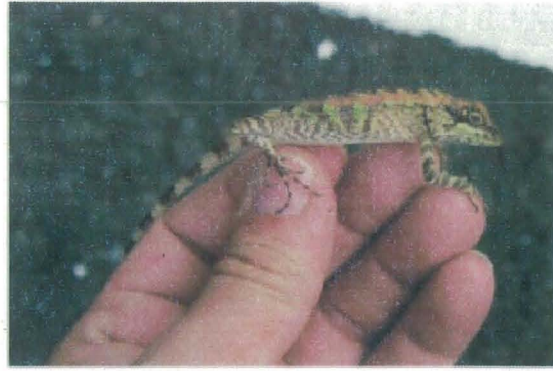
図3. 指宿市で捕獲されたオキナワキノボリトカゲの成体雌。活動時、胴部背面を横切る暗色帯が明瞭で、基亜種の特徴を示している。さらに個体によってはこのように、背中周辺が赤褐色となることもある。