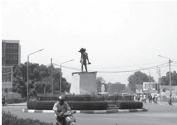
写真3：鉄道敷設闘争広場 (ワガドゥグ市)

開発計画に関しては、鉄道敷設を国民による闘争 (Batail du rail) と位置づけ、労働奉仕を強制した。1985年2月、鉄道敷設闘争が開始され、サンカラによってはじめのレールが設置された。当初の計画では、北東部の都市カヤ (Kaya) を皮切りに鉱物資源があるサヘル地方への延長が予定されていた 34) 。鉄道敷設闘争には、沿線地区の人々が動員された (Travail communautaire)。