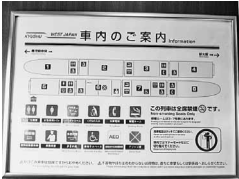
①JR西日本と共同の場合