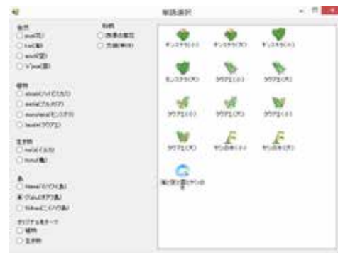
図8：モチーフ選択画面。

フラ衣装に使用されるモチーフはあらかじめ用意されていて、単語ごとに区分がなされている。単語選択ボタンを押すと、単語選択のフォームが別々に立ち上がり、単語を選択することができる(図8参照)。