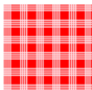
図5：パラカチェック。

本プログラムでは先行研究[2]と同様に無地とパラカの2種類の生地を用意した(図5参照)。フラ衣装と同じく RadioButton のチェックを変更することで表示の切り替えができるようになっており、パターン編集時にも変更可能である。