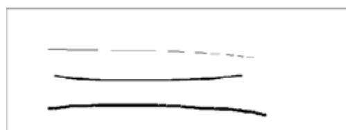
図10：線の太さの変更。

線の色の変更と同様にRadioButtonのチェックを変更して線の太さを変えることができる。本プログラムでも先行研究[2]と同じく大・中・小の3つより太さの選択ができ、初期値は小である(図10参照)。